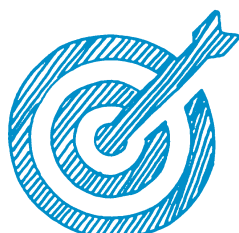
Executive Master Marketing