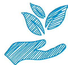
Diplome Universitaire Developpement Durable